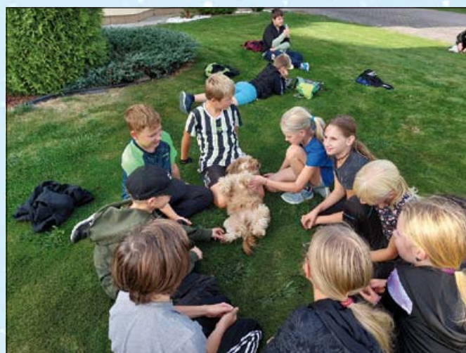
... a vůbec nezlobili; foto archiv ZŠ