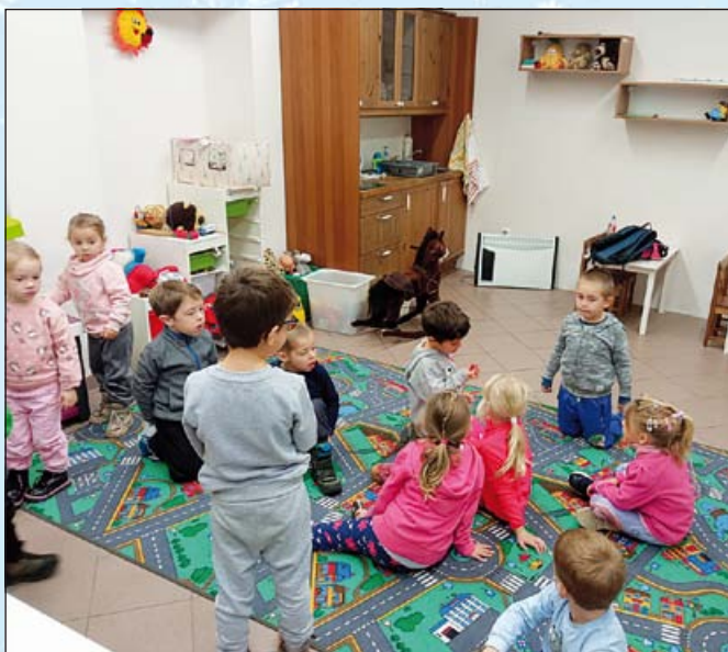
Kdo si hraje, nezlobí