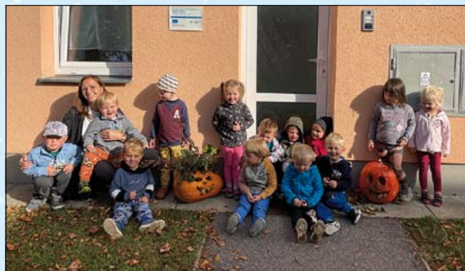
Ty dýně jsou velké jako my

přejí Vám všem, zaměstnanci ze spolkového domu.