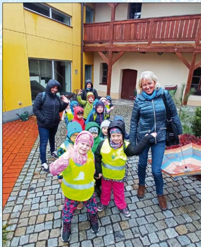
A vzhůru na cestu