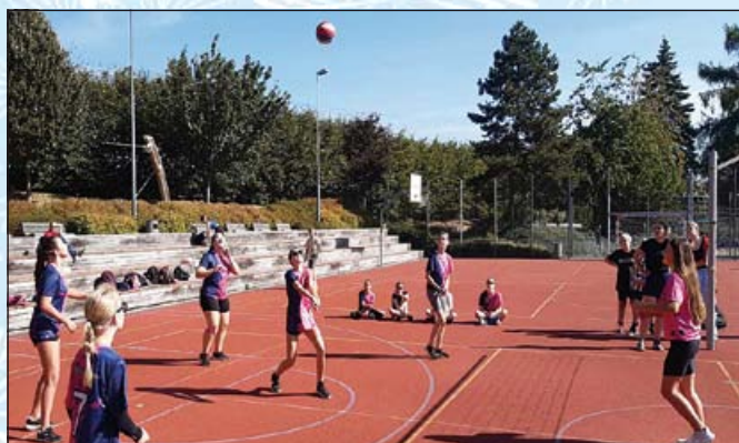
Hlavně ať se do toho trefím; foto archiv ZŠ