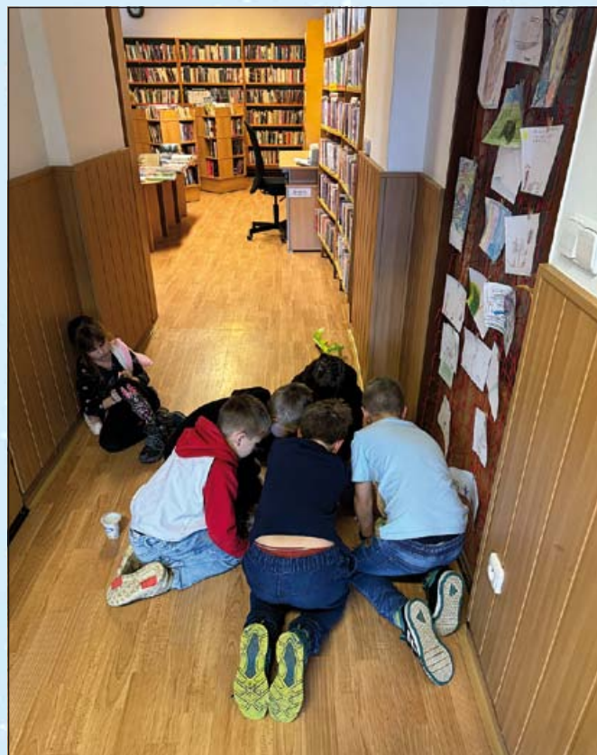
Úkoly plníme rádi