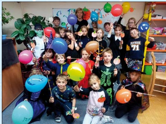
Halloween 3. oddělení; foto Adéla Hájková