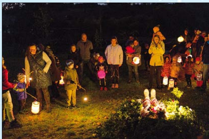
Halloweenská stezka