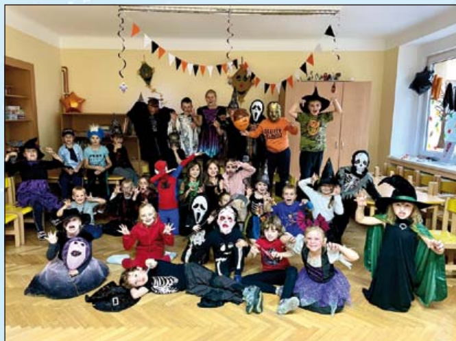
Halloween 1. a 2. oddělení; foto Adéla Hájková