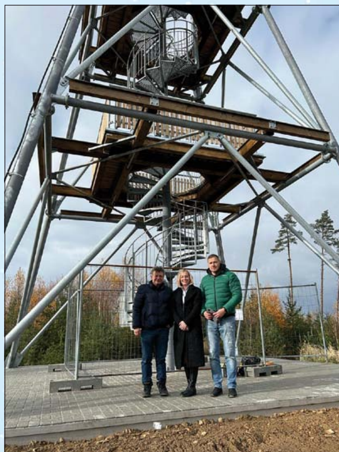
Zkolaudovaná rozhledna na Pasece