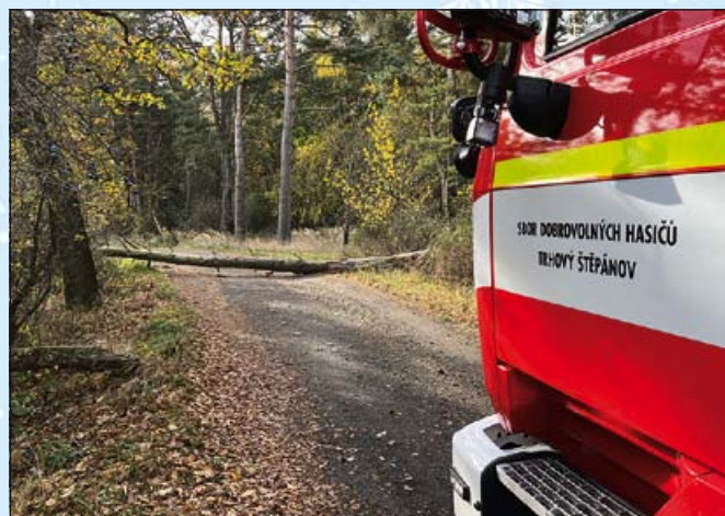
Odstranění spadlého stromu, Trhový Štěpánov