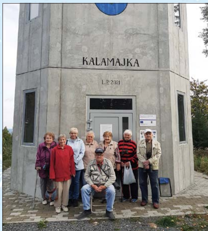
Před výstupem na Kalamajku