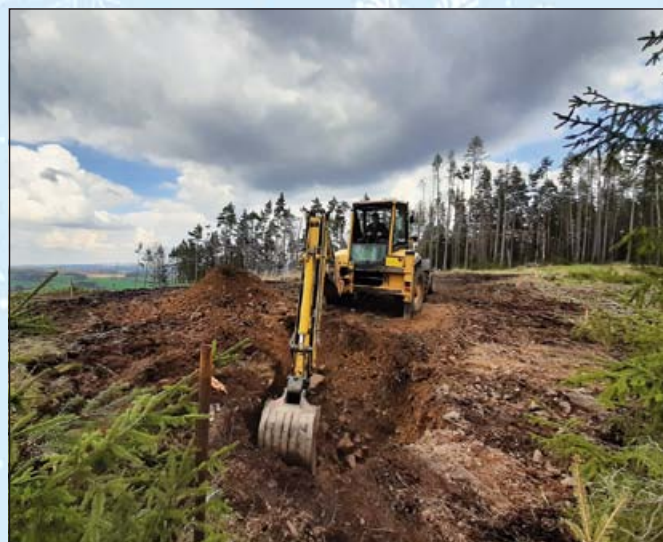
Zahájení stavebních prací na rozhledně