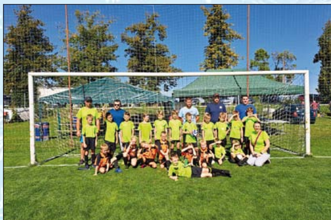
Přípravka