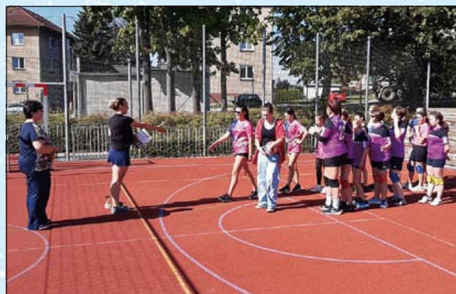
Předávání diplomů a cen