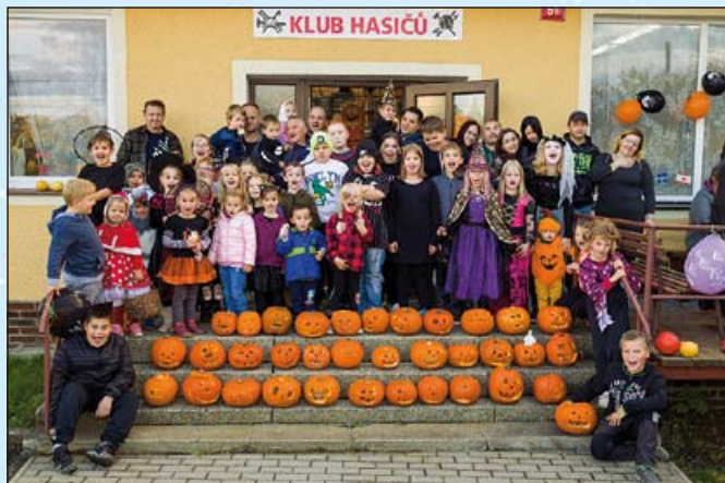
Dýně vyřezány

Prostory Klubu hasičů ve Střechově ožily v sobotu odpoledne 4. 11. opět oslavou keltského svátku Halloween. Celá budova byla tématicky vyzdobena. Nad hlavami poletovali netopýři, kostlivci a samozřejmě nechyběly děti