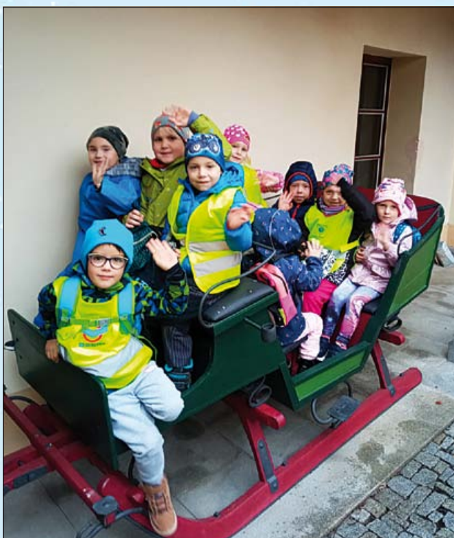
Vezeme oříšky pro Popelku