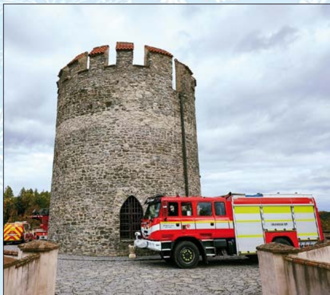
Taktické cvičení požáru hradu Český Šternberk