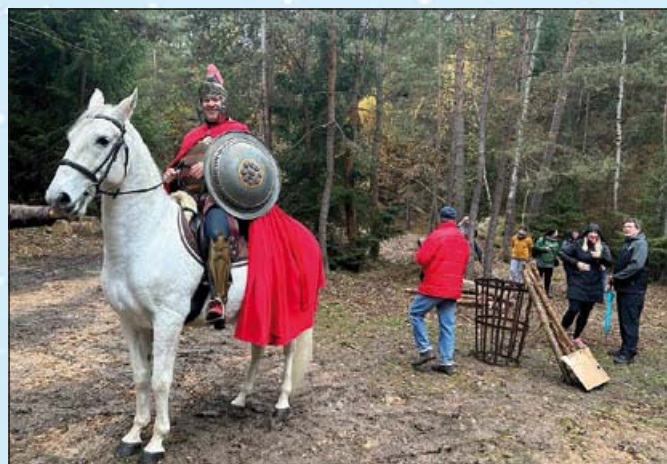
Sv. Martin přijel na bílém koni

Sobotní ráno, kdy se v kalendáři objevilo datum 11. 11., dávalo tušit, že tentokrát sv. Martin na bílém koni zřejmě nedorazí. Ten, kdo se chtěl přesvědčit na vlastní oči, našel si cestu mezi kapkami deště do areálu v lomu