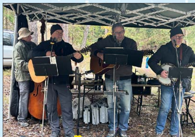
Na svatomartinském setkání zahrála country kapela; foto Josef Korn

Paseka, kde od 14.00 hodin začínal Svatomartinský kotlík. Na návštěvníky, kteří v nehostinném počasí přeci jen přišli, čekala teplá odměna v podobě „Cesty na severozá-