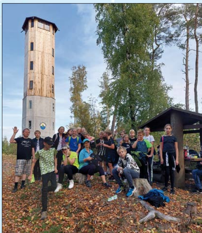
Kalamajku zdolali jsme...

zkazilo, měly jsme totiž šanci „zatrénovat si“ s technicky lepším týmem, vyzkoušet si fungovat jako jeden tým a užít si tuhle skvělou hru. Oba týmy si zaslouží uznání za skvělé výkony a nasazení. Děkujeme děvčatům z Postupic za jejich návštěvu a už se těšíme na předvánoční volejbal, který se uskuteční na Základní škole v Postupicích.