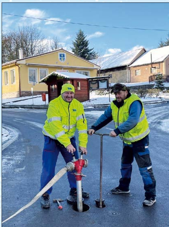
Kontrola přívaděče ve Střechově n.S.

Současně připravujeme podání žádosti o dotaci na další části vodovodního přívaděče s rozvodem v místních částech Sedmpány a Dubějovice. Horizont zahájení stavby v této chvíli nelze upřesnit, ale věřím, že jak dopadla stavba vodovodu do Střechova, bude úspěšná i akce přivedení vodovodu do Dubějovic a Sedmpán.