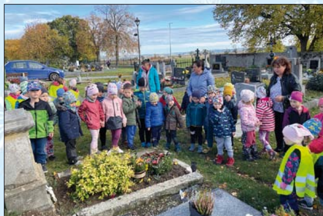
Naše dušičková cesta