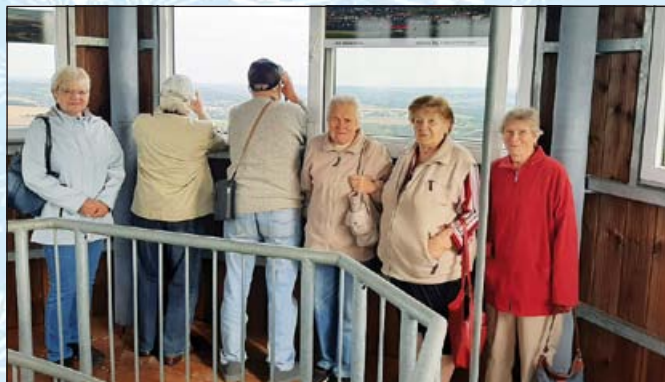
Rozhled z výšek

na Hojanovice, Koberovice a Vojslavice, až na Píšť, kde jsme si prohlédli dvojitý dálniční most, dále kostel v Ježově a ve Sněti oboru s daňky, jeleny a pštrosy. V Sedmápáněch jsme se rozloučili s částí účastníků výletu a tím byla naše cesta téměř u konce.