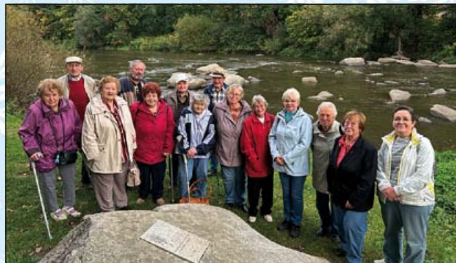
Na Stvořidlech

Velké poděkování patří panu starostovi Josefu Kornovi,