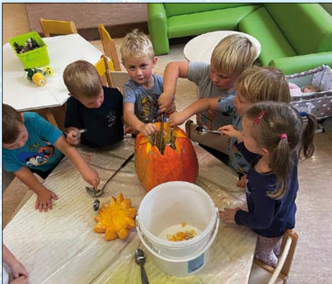
Tak to bude ještě fuška