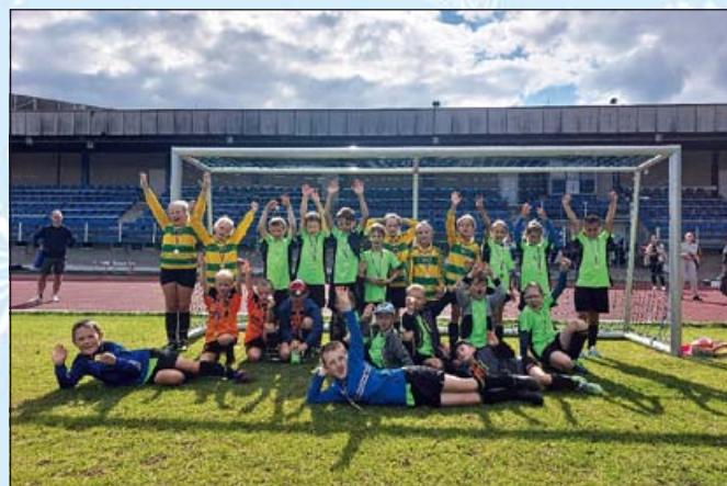
Naše naděje na vlašimském hřišti