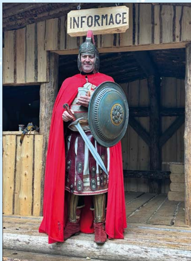
Světce ochutnal svatomartinské víno