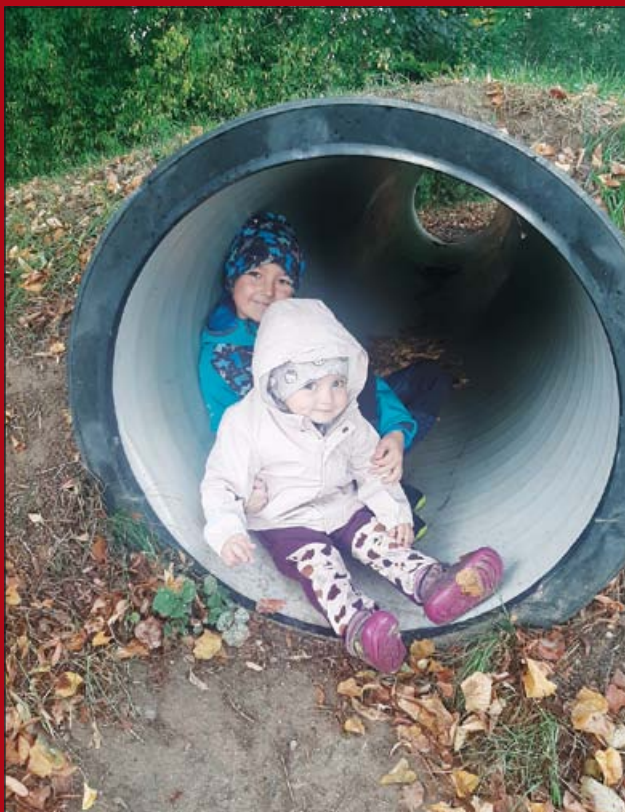
Herní prvky na hřišti v ul. Dalkovické