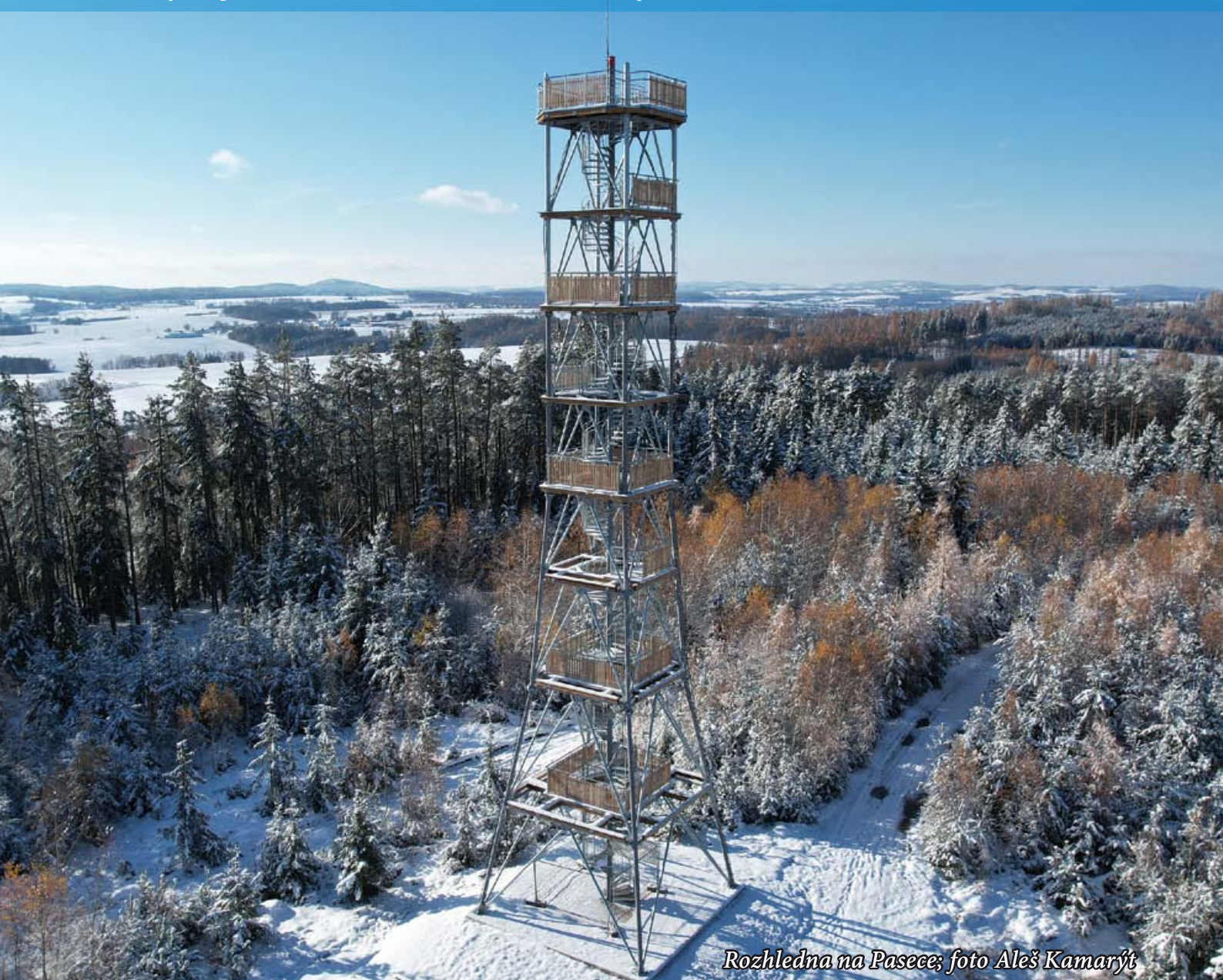
Rozhledna na Pasece; foto Aleš Kamarýt

Vydává město Trhový Štěpánov pro Trhový Štěpánov, Dalkovice, Dubějovice, Sedmpány, Střechov nad Sázavou a Štěpánovskou Lhotu