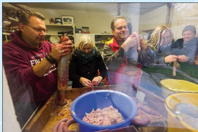
Výroba lahůdek v plném proudu