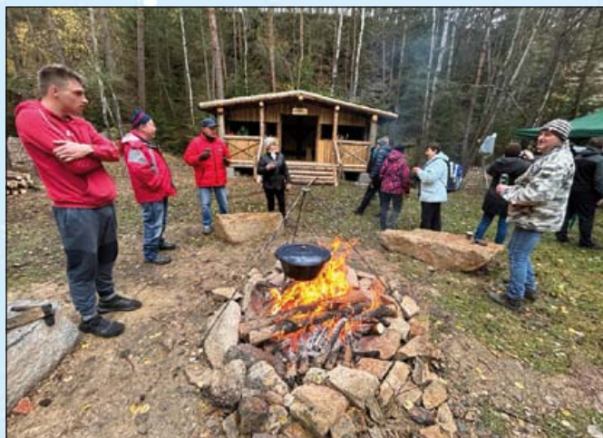
Cesta na severozápad probublává

I přes nepřízeň počasí byla premiérová akce v lomu úspěšná a přejeme si, aby byla počátkem dalších kultur-