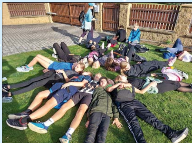
... na zahradě baterky dobili...; foto archiv ZŠ