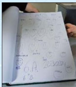
Byli jsme tady

Kalamajka mik, mik, mik, další výlet – směr Javorník, pěkně pěšky, stále vzhůru, hurá na Javornickou hůru. Kolik schodů je v té věži? Kdo to neví, ať sem běží. Kalamajku zdolali jsme, při výšlapu nasmáli se. U Matyho na zahradě, dobili jsme baterky a pak rychle zpátky domů, kde čekaly nás maminky.