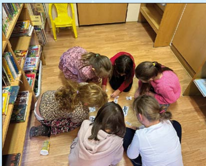
Čtenářský kroužek v plném nasazení